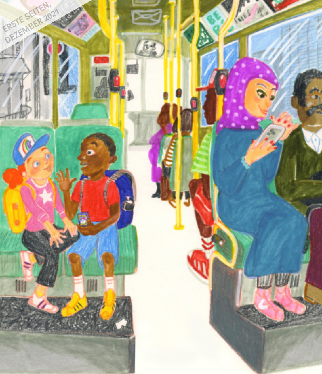
Tilda und Edi im Bus.