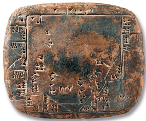
Babylonische Schiefertafel mit mathematischen Aufzeichnungen in Keilschrift